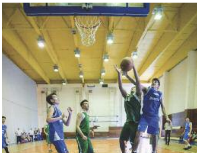
Ďalšou zo športových disciplín na PGSI bol basketbal. Tak ako na každom ihrisku, aj tu vládlo motto PGSI: Vždy veríme až do konca.