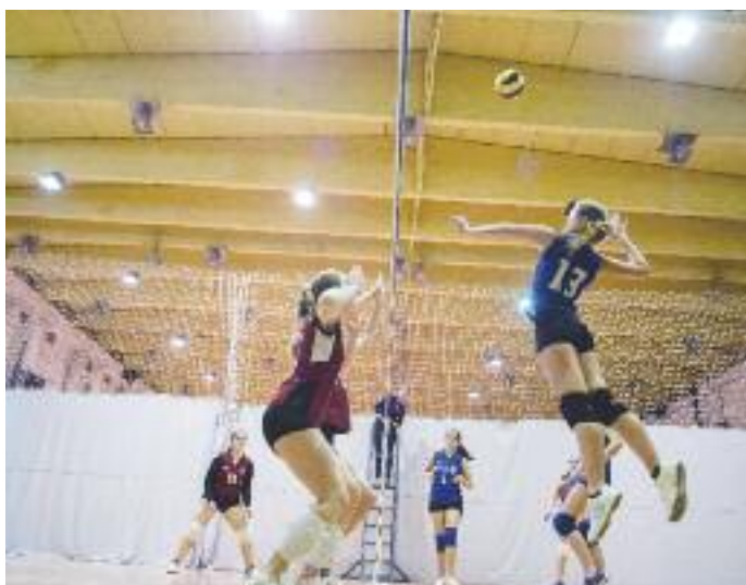
Na PGSI sa súťažilo aj vo volejbale. Do päťice súťažných disciplín patril ešte stolný tenis.