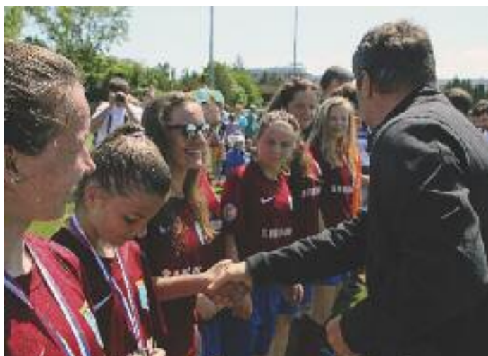
V záverečný deň si športovci po vybojovaných finálových zápasoch prevzali medaily. Následne sa presunuli do Rakúska, kde mali možnosť bližšie spoznať Viedeň.