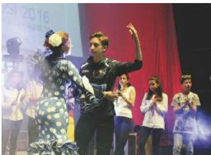
Oprášili sme tradíciu z PGSI, tzv. Expo. Jednotlivé krajiny si pripravili program, aby predstavili niečo zo svojej kultúry. Na pódium tak zaznievala v jednom momente pieseň Macejko, v druhom tóny španielskeho tanga.