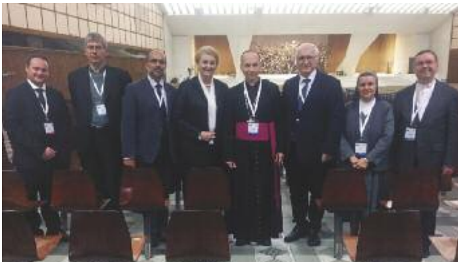
Slovenskí účastníci kongresu

Bolo cítiť, že sú tu – aj na kongrese – akoby dve časti, dve skupiny. Tento rozdiel bol v prístupe k samotnej téme,