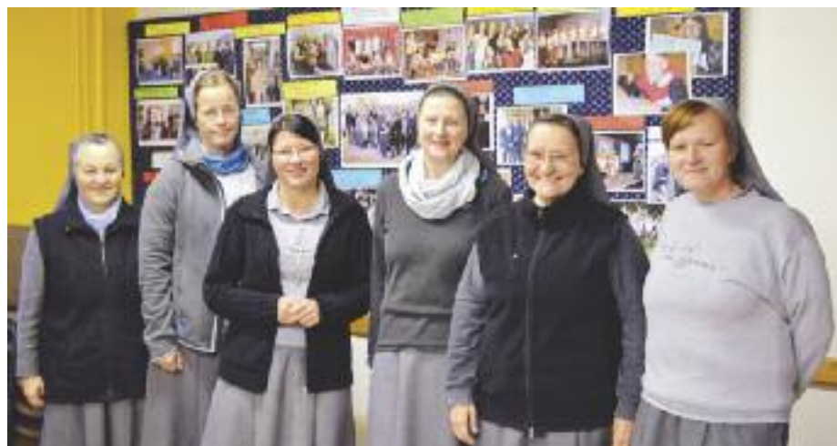
Komunita sestier saleziánok v Dolnom Kubíne (rok 2018)

Dolný Kubín, malé oravské mestečko, dýcha veľkou históriou. V roku 1877 tam zomrel autor slovenskej hymny Janko Matuška, v roku 1817 sa tam narodil Andrej Radlinský, zakladateľ Spolku svätého Vojtecha. Toto centrum dolnej Oravy sa spája aj s najväčším slovenským básnikom Hviezdoslavom. A práve tam pred 70-timi rokmi Pán zasadil komunitu sestier saleziánok. Aj ony píšu riadky histórie tohto mesta v živote detí a mladých.