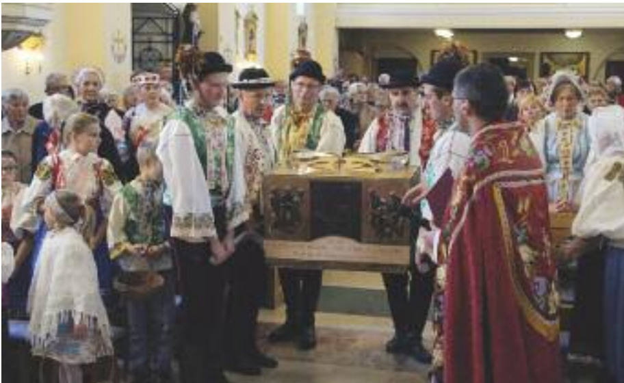
Prenesenie relikviára po blahorečení do kostola vo Vajnorochoch 1. októbra 2017