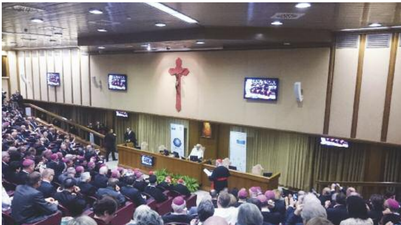
Svätý Otec medzi účastníkmi kongresu

akoby rozveseliť, lebo, ako povedal, Európa je plná pesimizmov. A má byť, naopak, kontinentom nádeje.