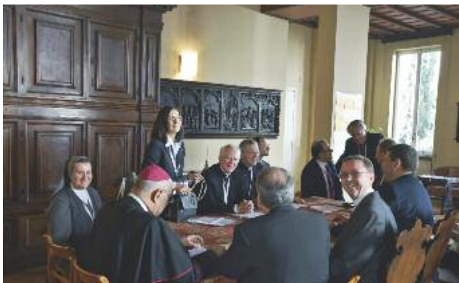
Sestra Janka v jednej z pracovných skupín

Má dve tváre – má tie svoje problémy, ktorých je dosť a pred ktorými si nemôžeme zakrývať oči, ale má aj svoju