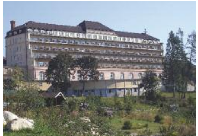
Liečebný dom Tatrasan, Nový Smokovec, foto: Jozef Kotulič, wikipedia

menej, niekedy viac – aj vyše tridsať ľudí, podaktorí sa chceli pri nás naučiť sa modliť. Chodili sa modliť katolíci, evanjelici ausburgského vyznania, pravoslávni i kalvíni. Chodili medzi nás ľudia s barlami i o palici po strmých schodoch. My sme sa učili prijať iných, oni sa učili prijať nás. Keď boli veľké búrky a víchrice, pochytili sme sa za ruky a modlili sme sa spoločne. Prichádzali sme na to, že modlitba v búrlivých Tatrách je jemným vánkom a balzomom na dušu, miesto pre apoštolát.