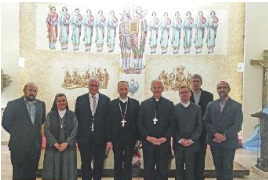
S kardinálom Tomkom v Pápežskom slovenskom kolégiu svätého Cyrila a Metoda v Ríme

Ja som vnímala cez neho, že mu na Európe skutočne záleží. Vložil sa do toho, aj keď bol chorý, unavený, napriek tomu nám dokázal venovať čas, prísť a potom sa aj s každým z nás krátko stretnúť. V príhovore zvýraznil niektoré veci, také, čo sú dôležité aj v jeho pontifikáte: priorita osoby a spoločenstvo. On to nazval stĺpy Európy. Bolo vidieť súzvučnosť, že to, čo hovorí, aj žije. Cez jeho príhovor vidím jeho konkrétne skutky, konkrétne gestá, ktoré od začiatku robí a povzbudzuje k nim aj predstaviteľov politiky či Cirkvi. V nás je totiž veľa strachu. To bola tiež taká pekná myšlienka, že sa potrebujeme