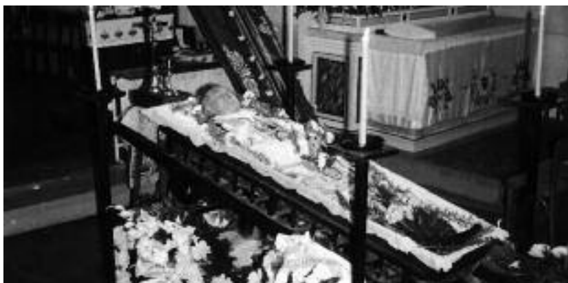
Telo dona Titusa v rakve, vystavené vo vajnorskom kostole

Ani nie mesiac pred smrťou, počas Vianoc, don Titus ukázal príbuzným na cintoríne miesto, kde chcel byť pochovaný. Jeho pohreb sa konal v sobotu 11. januára. Telo dona Titusa bolo vystavené v kostole, oblečené v ornáte vyšívanom vajnorským vzorom. Dostal ho ako dar pred niekoľkými dňami k narodeninám. A hoci bola zima, zvnútra rakvy po okrajoch poukladali množstvo kvetov. Ako víťazný veniec okolo zmučeného tela.